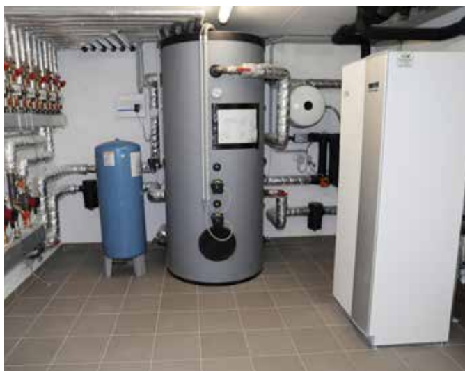
METRO Microbooster i en af lejlighederne.

Den helt store varmekilde finder vi i kælderen, hvor en større jordvarmepumpe henter varme op fra den østrigske undergrund og sender den ud til lejlighederne som gulvvarme. Returvarmen bliver herefter genanvendt i hver lejlighed, hvor METRO Microbooster booster temperaturen i vandet, så det kan bruges som varmt brugsvand.