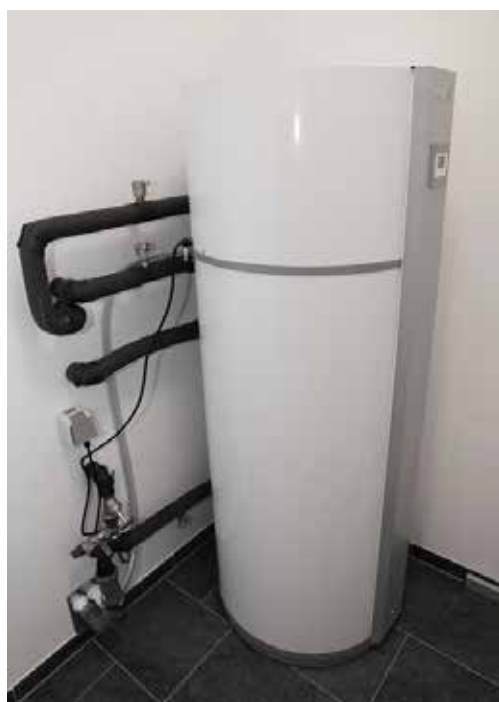
Jordvarmepumpen i kælderen